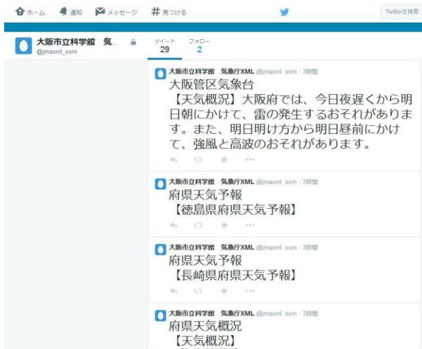
図4 Twitter 投稿例