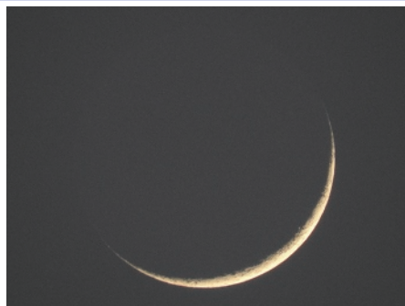
三日月は旧暦三日の月

ただ月は、地球の周りを平均29.5日で一周します。つまり、旧暦では1か月の日数は29日か30日になります。すると1年の日数は 29.5 \times 12 = 354 日と、365日に比べて11日ほど短くなり、このままだと3年で1か月もずれてしまいます。そのため、時々うるう月というものを設けて、調整する必要があるのです。