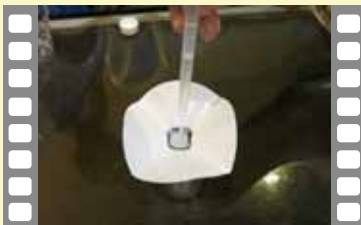
クロマトグラフィ 色インクのヒミツを調べます

他にもご提案できます。内容によってビデオの時間や準備が必要な材料が異なりますので、お気軽にご相談ください。