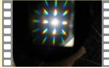
光の虹を見てみよう

10 種類あるサイエンスショーの中からお選びいただけます。また工作などと連動させることも可能です。