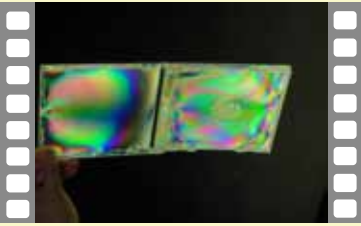
見える見えないの不思議