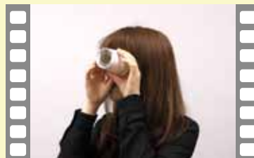
偏光ステンドグラス カラーフィルムを使わなくても きれいです。