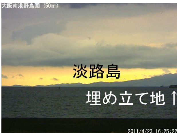
写真4. 南西方向のカメラで撮影した実景

また、焦点距離が50mm(35mm版換算で約400mm)のレンズを取り付けたカメラは、当初いろいろな方向を試してみたが、その後南西に向け、淡路島の山や大阪湾を通る船を撮影している。ただ、淡路島までの距離が50km以上と遠いため、かすんで島影が全く見えない日が多い。しかし、蜃気楼発生時に見られる逆転層が撮影されていることもあり、この方向の観測を続けている。