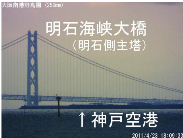
写真3. 西方向のカメラで撮影した実景