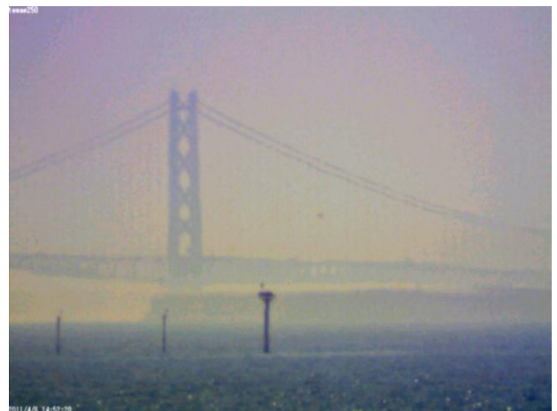
写真5. 2011年4月6日の蜃気楼

また、このときはまだ明石海峡大橋の明石側主塔を比較的画面の中央よりに撮影していた。しかし、明石海峡大橋のケーブルの低い部分も蜃気楼の対象分として重要であるため、その後画角を少しずらした。