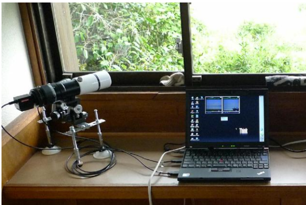
写真2. 大阪南港野鳥園に設置した固定カメラ

撮影および転送には、複数台のUSBカメラに対応できる「LiveCapture2」というフリーソフトを使用。サーバーに転送されたファイル(ファイル名に年月日時分秒が入っている)は、自作のソフトを使い、約2分前に撮影された画像のファイル名を決まったファイル名に変更することで、HPで表示されるようにしている。ここで約2分前にしているのは、書き込み中のファイルにアクセスすることを防止するためである。また、このソフト