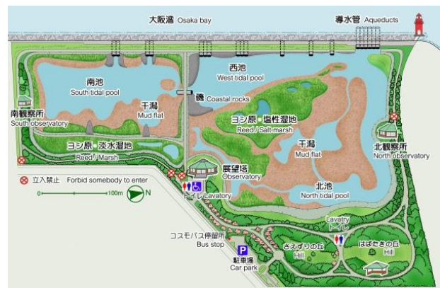
図1. 大阪南港野鳥園の見取り図

展望塔は周囲がガラス張りで、上部は大きなはめ込み式のガラス窓、下部に開閉式の小さなガラス窓になっている。ただ、野鳥をガラス越しに双眼鏡で観察したり望遠レンズで撮影することから、一般の窓に使用されるガラスと比べると、光学的に精度の高い板ガラスが用いられている。