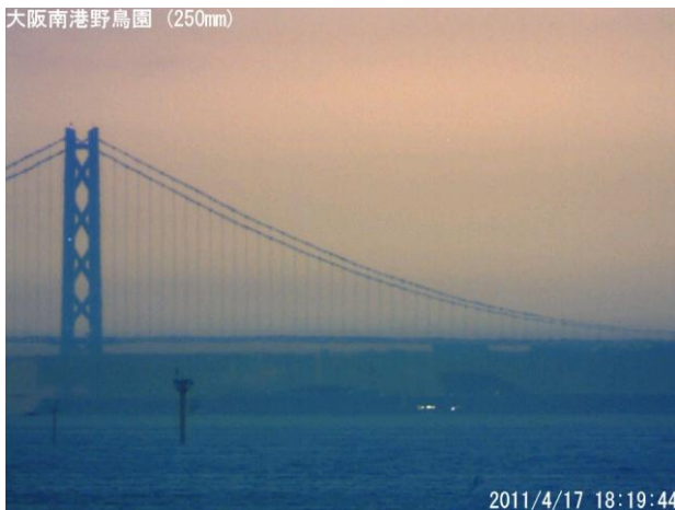
写真6. 2011年4月17日の蜃気楼 (18時19分44秒撮影)

しかし、大阪南港野鳥園が閉園した17時を過ぎてから、明石海峡大橋の橋桁や神戸空港の空港島にも大きな変化が現われたことが固定カメラによってとらえられた。この変化は、日が暮れた18時40分くらいまで続いた。