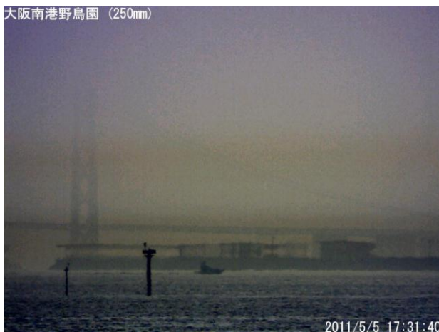
写真7. 2011年5月5日の蜃気楼 (17時31分40秒撮影)

14時40分頃から海の部分の上に伸びる蜃気楼が顕著になり、その後明石海峡大橋の橋桁や神戸空港の空港島などの伸びや変形が18時30分頃まで続いた。特に17時30分頃には、神戸空港の空港島の一部が上下反転し、一部が宙に浮いているような状態となった。