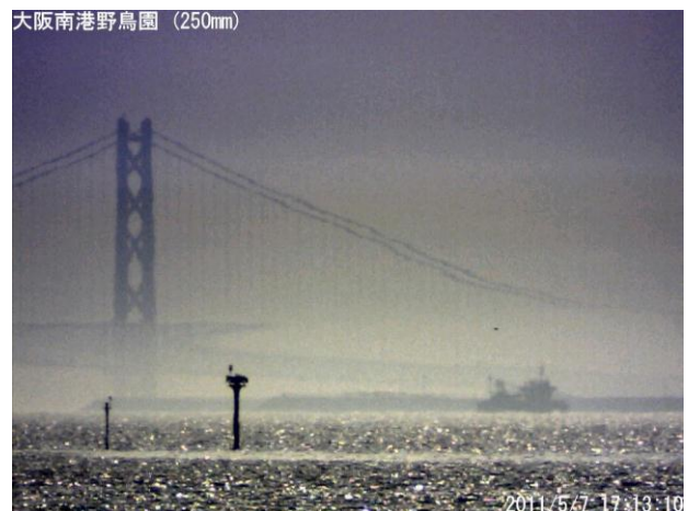
写真8. 2011年5月7日の蜃気楼 (上:17時03分19秒撮影、下:17時13分10秒撮影)