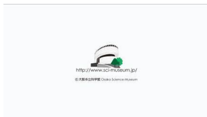
エンディング画面