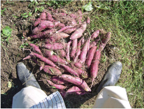
図1 サツマイモの収穫

著者の趣味は野菜の栽培、図1はこの10月に収穫したサツマイモで、9kg。期待していたよりもかなり少なめでしたが、至福のひとつきを味わいました。サツマイモは料理本に100gあたり132kcalとありますので、12000kcalの自然エネルギーを太陽光から得たことになります。ただし、これは人間が食した場合のエネルギーです。イモのままでは燃料としては使えないし、腐るのでエ