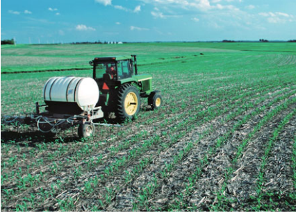
図3 アイオワでのトウモロコシ畑への施肥

上の議論は素人栽培を根拠にしています。そこで、米国のトウモロコシと著者のサツマイモ栽培を比較してみましょう。米国は世界最大のバイオマスエタノール生産国です。年間3.2億トンのトウモロコシが3300万haの畑で栽培されています。この収穫は1㎡あたり1kg、著者は4㎡で9kgのサツマイモです。トウモロコシからエタノールはサツマイモの場合の3倍ほど生成されますので、エタノール生産で比較すると、米国のトウモロコシも