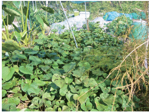
図2 サツマイモの畝

図2はサツマイモの畝、栽培面積は4㎡。ここに太陽光が降り注いで、光合成でエタノール1.2リットル分のエネルギーしか蓄えられなかったのです。葉の代わりに太陽光パネルを使ったらどれぐらいになるか気になるので、計算してみましょう。まずは気象庁が公開している日射量を使います。栽培期間の6月から10月半ばまでを足し算すると、日射量は560億J/㎡になりました。ここで、J