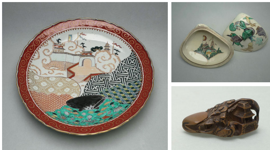
写真2. 夢見蛤の図案が使われている皿(左)、器(右上)、根付(右下)