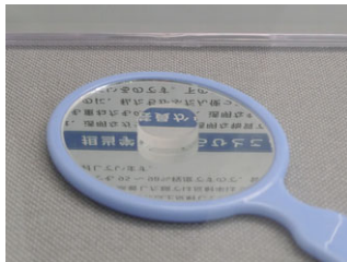
多層膜干渉ミラー (中央の小さい鏡)

しゃぼん玉は透明な石けん水でできているのに虹色に見えますね。また、メガネやカメラのレンズの表面で反射した光が、コーティングによって緑色や紫色になっているのを見たことはないでしょうか。しゃぼん玉やコーティングの薄い膜の厚さが光の波長(およそ 0.4\sim 0.8\mu\text{m} )程度だと、表面で反射した光と裏面で反射した光が干渉という現象を起こします。光には波の性質があるので、表面で反射した光の波の山や谷が、裏面で反射した光の波の山や谷と、一致すると強め合い、山と谷があべこべになると打ち消し合うのです。屈折率の異なる2種類の物質を交互に何層もコーティングすることで、ある色の光を強く反射させることができ、さらに層の厚さを変えることにより、ある程度の色の範囲の光を反射させることもできるのです。