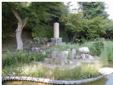
図1. 金星観測記念碑

その先は山道になりますが、碓山・市章山辺りまで往復すると、ちょっとしたハイキングコースになります。