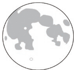
①午後 時 分