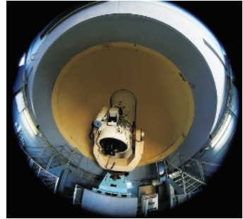
図. 天文台からライブ中継

プラネタリウムがネットとつながり、外部の映像を映せるようになります。この機能で、遠くの星空を生中継するイベントも予定しています。また、最新の情報も解説にどんどん入れていきます。宇宙ステーションの見え方なども映像で紹介できるようになりますよ。