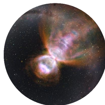
惑星状星雲バタフライ星雲