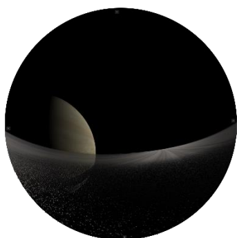
土星リングに接近