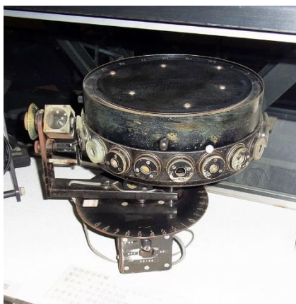
■カールツァイス社製 星座絵投影機

プラネタリウムドームに星座の絵の線画を映し出すための投影機で、電気科学館時代に使われていたものです。