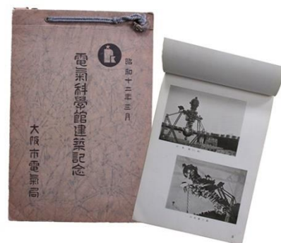
■冊子『電気科学館建築記念』

1939(昭和14)年頃に作られたプラネタリウムの解説リーフレットです。「天象館」はプラネタリウム施設の名称、その下にある「星の劇場」は愛称です。