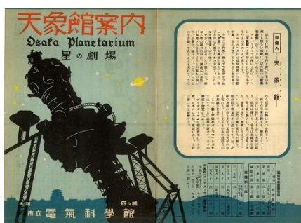
■天象館(てんしょうかん) 案内リーフレット

プラネタリウムドームに星座の絵の線画を映し出すための投影機で、電気科学館時代に使われていたものです。