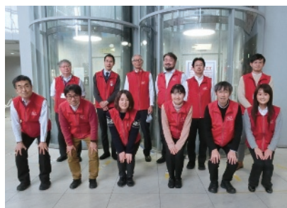
大阪市立科学館の学芸員。

活動の初回は、まず入会手続きと活動についての説明会をおこないます。科学館はリニューアル工事のために夏まで休館していますが、ジュニア科学クラブは館内で活動をおこないます。